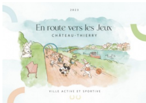
JEUX OLYMPIQUES ET PARALYMPIQUES PARIS 2024 Appel à projets à destination des associations