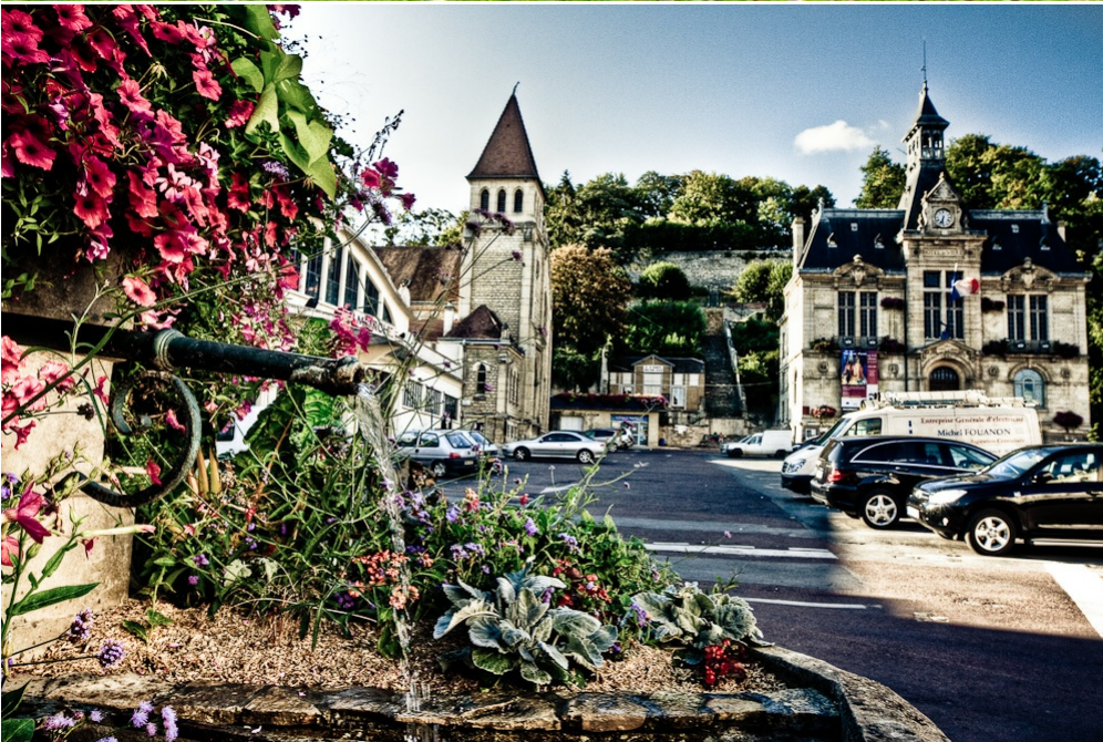
Source URL: https://www.chateau-thierry.fr/article/chateau-thierry-accueil-villes-et-villages-fleuris