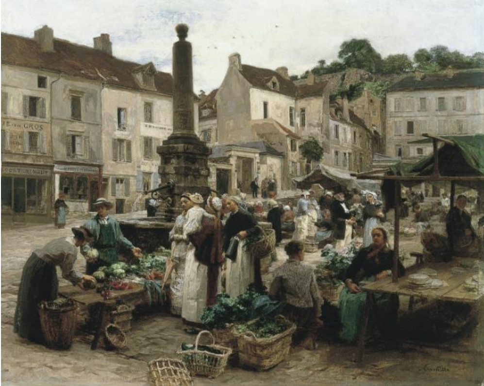
Léon Lhermitte, Le marché de Château-Thierry , 1879