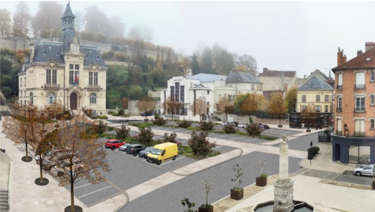
Projection 3D (projet) – consultation citoyenne – version janvier 2023