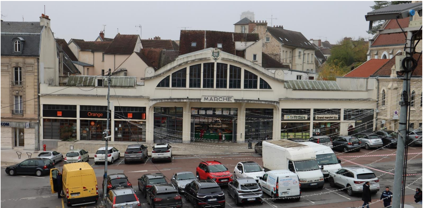
Marché couvert – état actuel