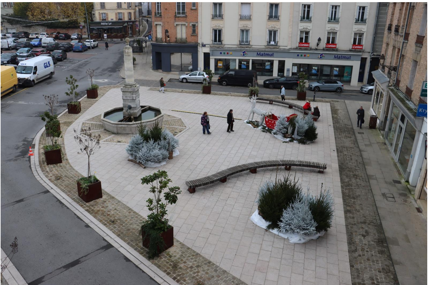
Carrefour du Beau Richard – état actuel