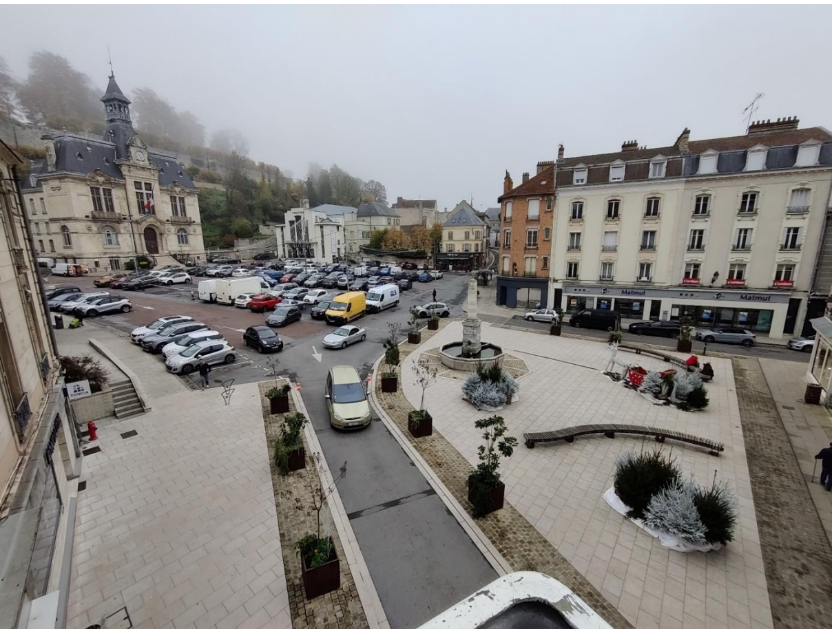
Vue d'ensemble – état actuel