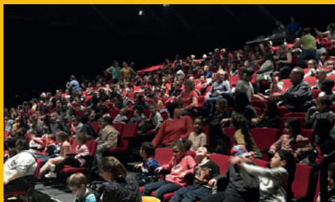
Les élèves des écoles des Vaucrises au spectacle jeune public Loulou le 22 mars 2019

Cette saison, le Palais des Rencontres propose une programmation jeune public avec des spectacles adaptés à tous les âges et des horaires aménagés pour une représentation gratuite à destination des scolaires.