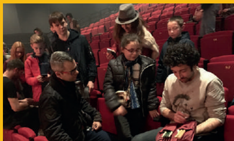
Les élèves de percussion du Conservatoire Eugène Jancourt et de l'Union Musicale ont rencontré les batteurs des Fills Monkey lors de la première date du Palais des Rencontres le 8 mars 2019

Selon les spectacles, des ateliers pédagogiques et des rencontres autour des spectacles pourront être mis en place avec l'équipe du Palais des Rencontres.