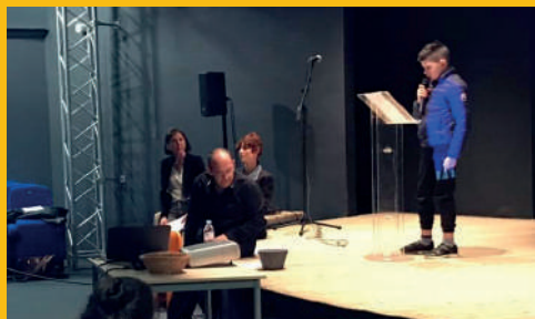
« Les Rencontres de Slam » ont été organisées en parallèle de la venue de l'artiste Grand Corps Malade