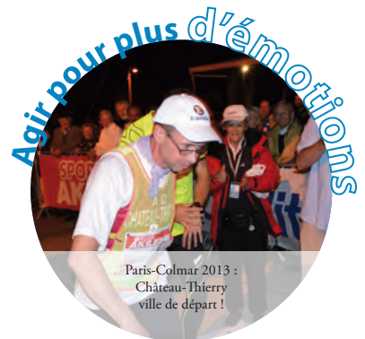
Paris-Colmar 2013 : Château-Thierry ville de départ !