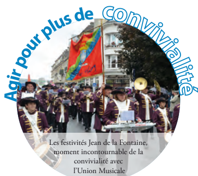
Les festivités Jean de la Fontaine, moment incontournable de la convivialité avec l'Union Musicale

Le Conseil Municipal s'est tenu le Mercredi 19 Juin 2013. Dans la continuité de l'action menée sans relâche depuis 5 ans, des décisions importantes ont été prises.