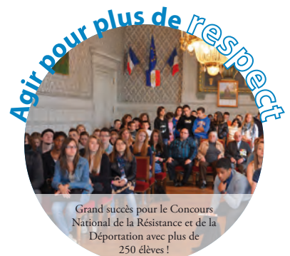
Grand succès pour le Concours National de la Résistance et de la Déportation avec plus de 250 élèves !

Dès notre arrivée, en 2008, nous avons toujours agi dans la plus totale transparence. Nous avons réduit les indemnités, supprimé la voiture de fonction du maire, réduit considérablement les frais de bouche et de réception. Aujourd'hui, nous voulons donner un cadre à la fois officiel et solennel à la façon dont nous avons conçu notre pratique politique. Nous avons décidé d'élaborer une charte d'éthique et de déontologie à destination des élus de notre ville. Si nous disons oui au débat d'idées dans un esprit de tolérance, nous disons non aux postures partisans et politiciennes !