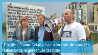
Le collectif "Carmen" était présent à l'occasion de la manifestation contre les gaz et huile de schiste

► OÙ EN SOMMES-NOUS ? Réunion jeudi 4 juillet, 20 h, en présence de Corinne Lepage, eurodéputée, 8 rue du château.