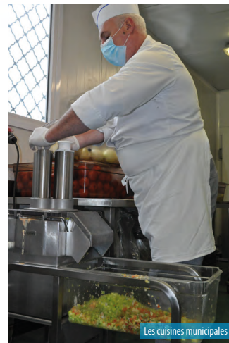
Les cuisines municipales