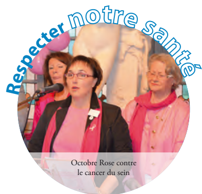
Octobre Rose contre le cancer du sein

Ainsi, tous les ans seront analysés par des personnalités extérieures et publiés : le montant des indemnités, le nombre de présences, les frais de bouche et de déplacements de vos élus, etc. . . . Pour nous, jamais nous n'irons assez loin pour démontrer notre volonté de transparence. Etre animé de cet état d'esprit, c'est bien ! Le démontrer, c'est encore mieux !