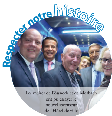
Les maires de Pössneck et de Mosbach ont pu essayer le nouvel ascenseur de l'Hôtel de ville