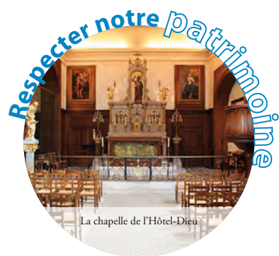
La chapelle de l'Hôtel-Dieu