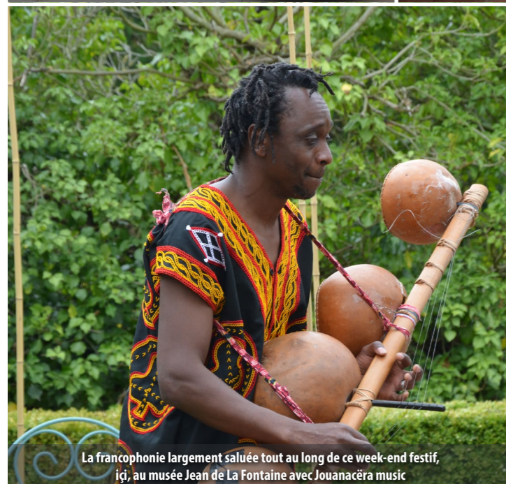
La francophonie largement saluée tout au long de ce week-end festif, ici, au musée Jean de La Fontaine avec Jouanacéra music