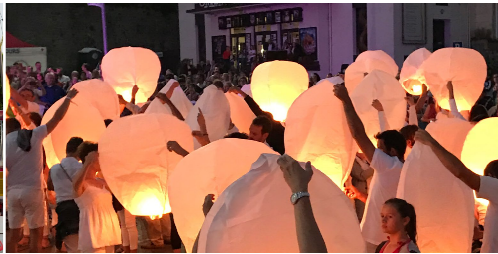
Avec les lanternes, les habitants de la Cité à Fables portent haut les valeurs de l'UNESCO