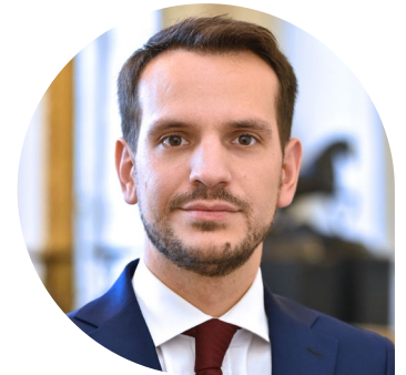
Sébastien EUGÈNE Maire de Château-Thierry