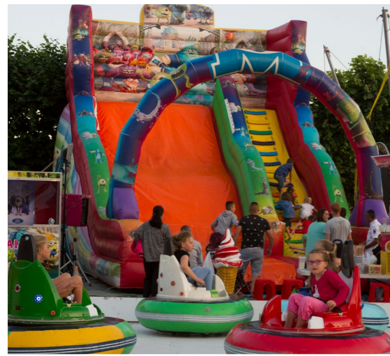
La fête foraine a fait le bonheur des petits castels

Jean de La Fontaine et la francophonie au cœur des festivités