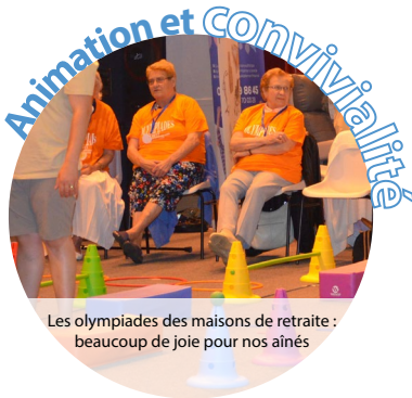
Les olympiades des maisons de retraite : beaucoup de joie pour nos aînés