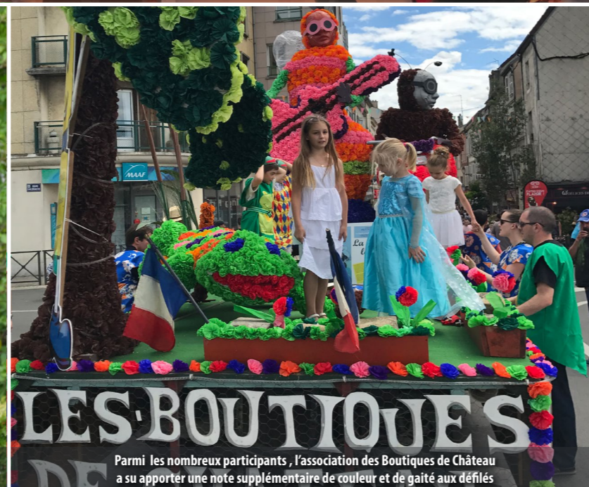
Parmi les nombreux participants, l'association des Boutiques de Château a su apporter une note supplémentaire de couleur et de gaieté aux défilés

Merci aux membres du Photo club Arc-en-Ciel pour leur présence à l'occasion de cette fête conviviale et pour la qualité de leurs prises de vues.