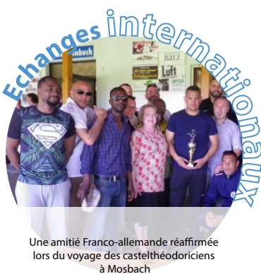
Une amitié Franco-allemande réaffirmée lors du voyage des castelthéodoriciens à Mosbach

Chèr(e)s Castelthéodoricien(ne)s, Devenir maire de notre Ville, si belle, si agréable à vivre, si riche de ses habitants et de son histoire, est une profonde fierté et un immense honneur. Le soutien des élus et vos encouragements ces derniers jours m'ont profondément touché.