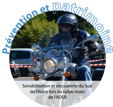
Sensibilisation et découverte du Sud de l'Aisne lors du rallye moto de l'ADSR