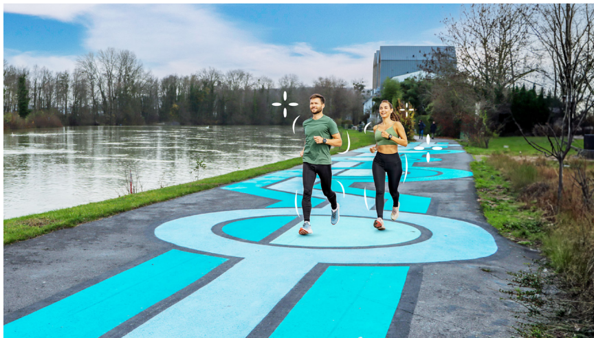
La fresque au sol en bord de Marne vise à favoriser l'activité physique.

Le design actif consiste à aménager l'espace public et les bâtiments afin d'inciter à l'activité physique ou sportive, de manière libre et spontanée, pour tous.