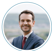
Sébastien Eugène, Maire de Château-Thierry

Nous vous donnons rendez-vous au Club 2024 du 23 juillet au 11 août pour profiter pleinement de l'ambiance des Jeux !