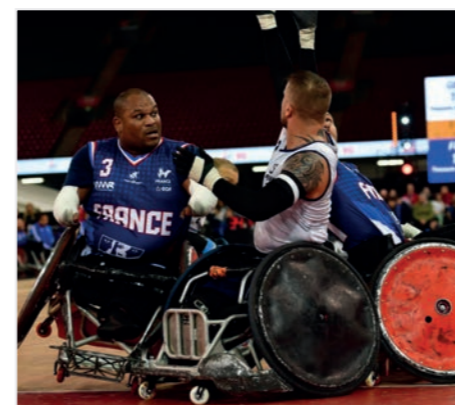
Les Français ont battus les champions paralympiques en titre

1 ère sélection en équipe de France (U23) Participation à la 1 ère , 2 e et 3 e manche de la Coupe du Monde U23 féminine de cross-country