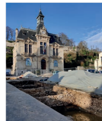
Château-Thierry participe à des colloques internationaux

La Ville collabore avec l'Université de Rennes II pour participer au colloque international qui se tiendra à Montréal en octobre prochain sur le thème « étudier la guerre ».