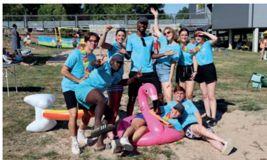
Château plage offre l'opportunité aux Castels de passer de bons moments en famille ou entre amis