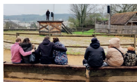
La variété et la beauté des espèces a de quoi divertir le public