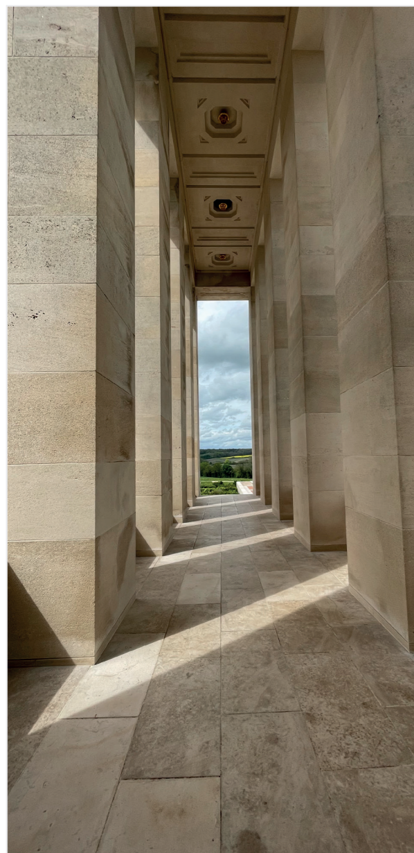
Postée le 29 mai 2023 par @maximethpt sur Instagram

VOUS VOULEZ VOIR VOTRE PHOTO DANS LE PROCHAIN MAGAZINE ? Prenez notre ville en photo et postez-la sur Instagram avec le #chateauthierry @villedechateauthierry @villedechateauthierry