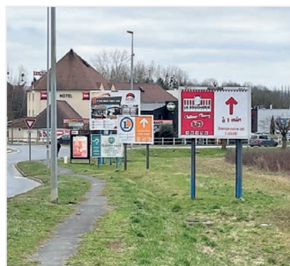
La municipalité est déterminée à réduire la place de la publicité en ville

Avec l'appui de la communauté d'agglomération, la Ville de Château-Thierry a décidé de réviser son Règlement Local de Publicité (RLP), approuvé en 1987. Les objectifs consistent à limiter l'impact de la publicité sur les paysages et le cadre de vie, à protéger et valoriser le patrimoine bâti et naturel, à améliorer l'attractivité économique.