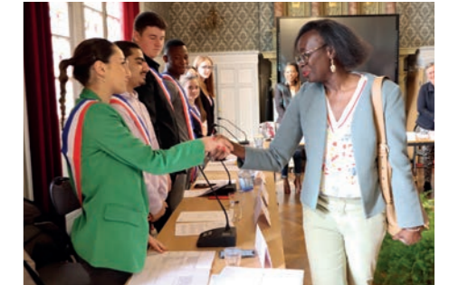
Le CMJ a restitué l'ensemble de ses travaux en présence de Madame la Sous-Préfète

Ces propositions alimenteront les feuilles de routes 2024 - 2026 qui seront élaborées à l'automne.