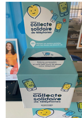
Une boîte de collecte est notamment disponible en mairie