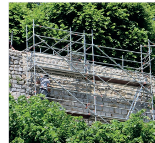
La zone sud du château sera progressivement rénovée

L'objectif est de rendre l'emprise de la roseraie Thibaut IV de Champagne propre et nette, avec un front de rempart impeccable entre la tour bouillon et la tour rouge, au-dessus de la mairie. Les travaux devraient se poursuivre jusqu'en 2025, au moment du réaménagement de la place de l'Hôtel de Ville pour rendre l'ensemble de cette zone harmonieuse.