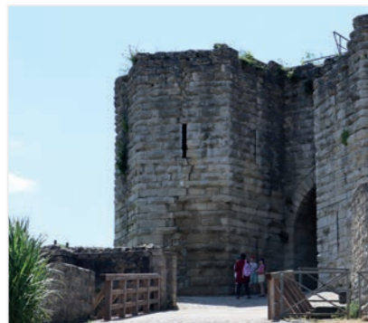
Le site du château médiéval se caractérise par sa riche biodiversité

Le château médiéval de Château-Thierry est un lieu propice à l'observation de la vie sauvage. Parmi les espèces les plus présentes, les chauves-souris sont particulièrement remarquables.