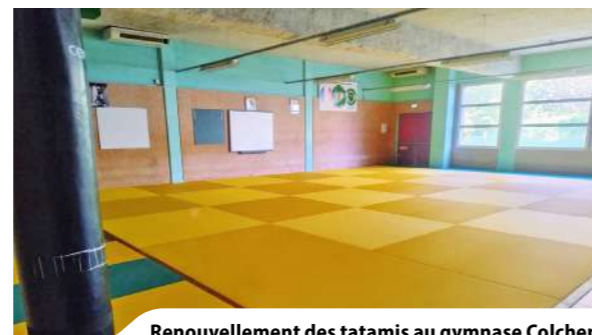
Renouvellement des tatamis au gymnase Colchen