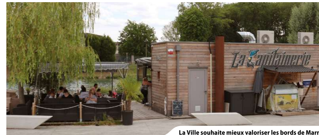
La Ville souhaite mieux valoriser les bords de Marne

La municipalité poursuit son engagement pour renforcer l'attractivité de Château-Thierry. Les bords de Marne font l'objet d'une attention particulière pour garantir la pérennité des activités qui en font un lieu prisé.