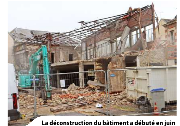
La déconstruction du bâtiment a débuté en juin

Sur le site de l'ancienne carrosserie Desson, au cœur de l'île de Château-Thierry, la déconstruction du bâtiment est réalisée par les propriétaires. Devenu une friche, ce site s'inscrit dans un projet de reconversion en logements privés. La Ville a accompagné l'avancement de ce dossier afin de permettre l'évolution de cette friche en cœur de ville. Sans occulter l'histoire du lieu, cette opération constitue une étape dans la requalification progressive du secteur.