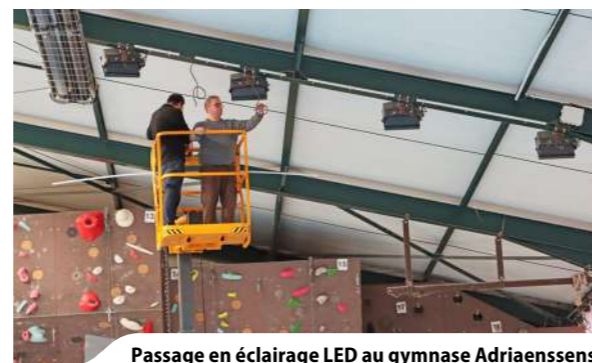
Passage en éclairage LED au gymnase Adriaenssens

› À Blanchard, dans le bois situé à proximité de l'école, un ancien terrain de pétanque laissé à l'abandon depuis plusieurs années a été entièrement réhabilité par les services municipaux.