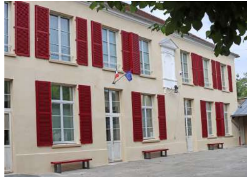
Après la façade en 2025, les travaux se concentrent sur l'isolation intérieure

Pendant l'été, la municipalité poursuit la rénovation des bâtiments scolaires. Parallèlement, les équipements sportifs bénéficient de travaux et de remises à niveau.