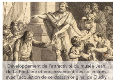
Développement de l'attractivité du musée Jean de La Fontaine et enrichissement des collections avec l'acquisition de ce dessin original de Oudry

La maison natale de Jean de La Fontaine entre dans une phase de renouvellement de sa muséographie. Dans cette perspective, un dessin original de Jean-Baptiste Oudry, a été acquis par la Ville, avec un très fort soutien financier de la DRAC et le concours de l'Association pour le musée.